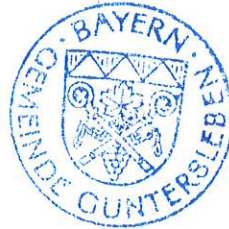
Klara Schömi 1. Bürgermeisterin

An der Amtstafel angeheftet am 02.06.2021